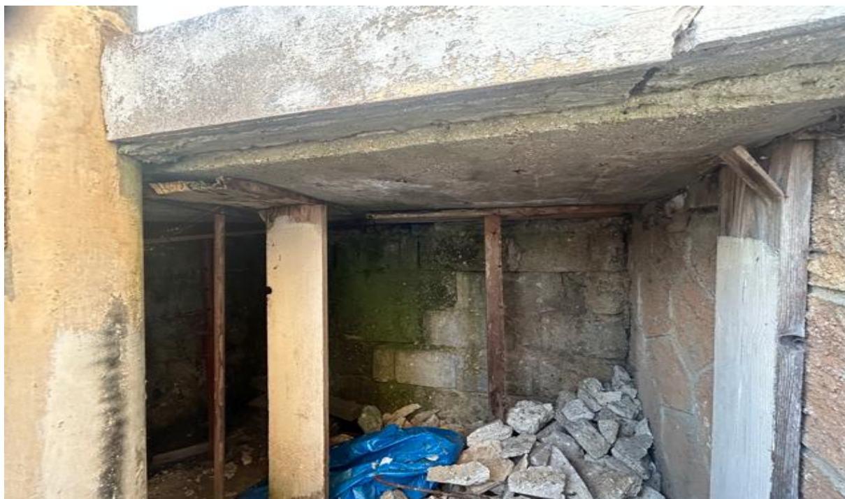
PHOTO D'ENSEMBLE AVANT TRAVAUX

Démolition et création du nouveau plateau de l'escalier